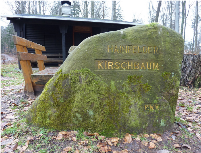
Ritterstein Nr. 77 Hainfelder Kirschbaum südlich von Helmbach und Appenthal (2013)