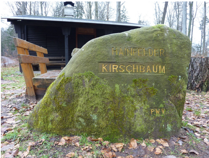
Ritterstein Nr. 77 Hainfelder Kirschbaum südlich von Helmbach und Appenthal (2013)