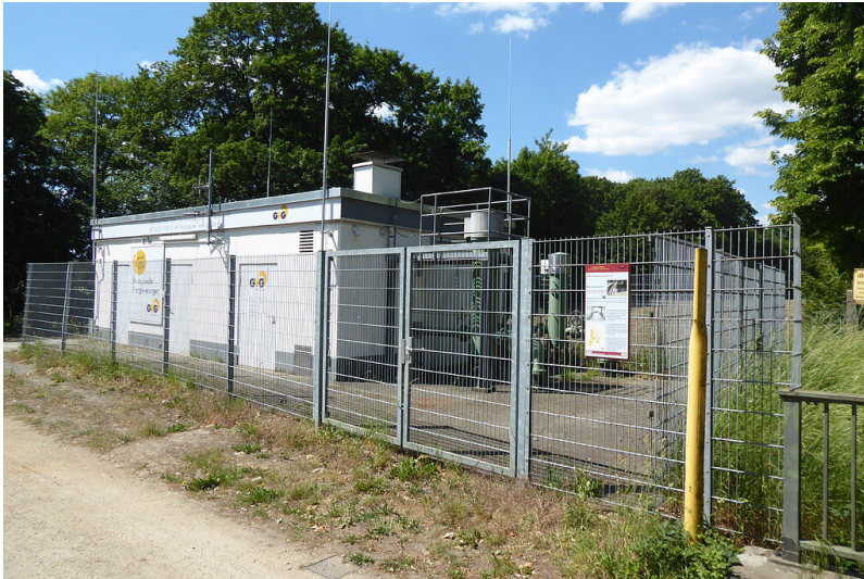
Erzählstation "Übernahmestation GVG Rhein-Erft" am Kölner Randkanal (2020)