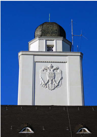
Der Meldeturm außer Dienst der Feuerwache Lindenthal in Köln-Lindenthal (2020).

Schlagwörter: Feuerwehrhaus , Schlauchturm , Spritzenhaus , Wappenstein Fachsicht(en): Kulturlandschaftspflege , Landeskunde , Architekturgeschichte Gemeinde(n): Köln Kreis(e): Köln Bundesland: Nordrhein-Westfalen