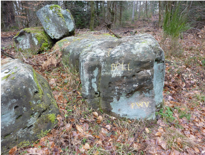
Ritterstein Nr. 83 Boll südöstlich von Iggelbach (2013)