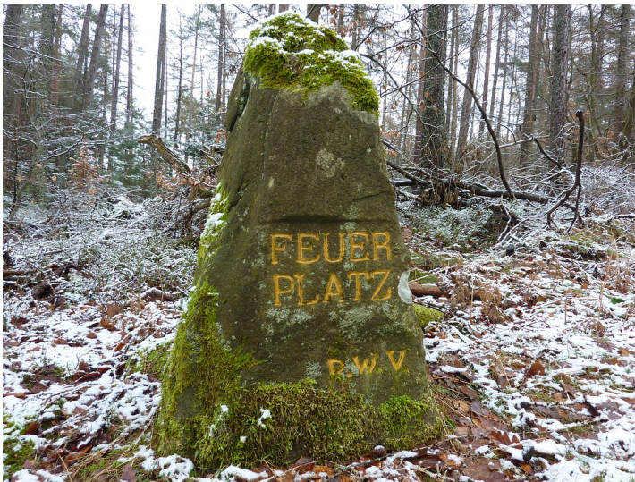
Ritterstein Nr. 76 Feuerplatz (2013)