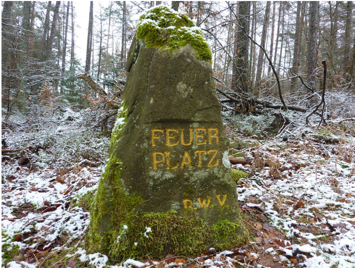
Ritterstein Nr. 76 Feuerplatz (2013)