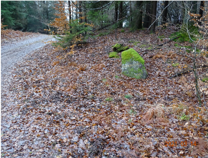
Ritterstein Nr. 75 Todtermann nördlich von Ramberg (2021).