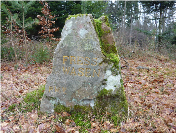
Ritterstein Nr. 74 Fresswasen östlich von Hofstätten beim Erenkopf (2013)