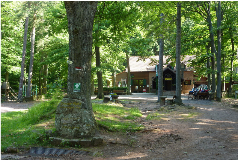
Ritterstein Nr. 58 Zimmer-Platz bei Erbauung der Burg Scharfeneck, später Schlossgarten bei der Landauer Hütte (2013)