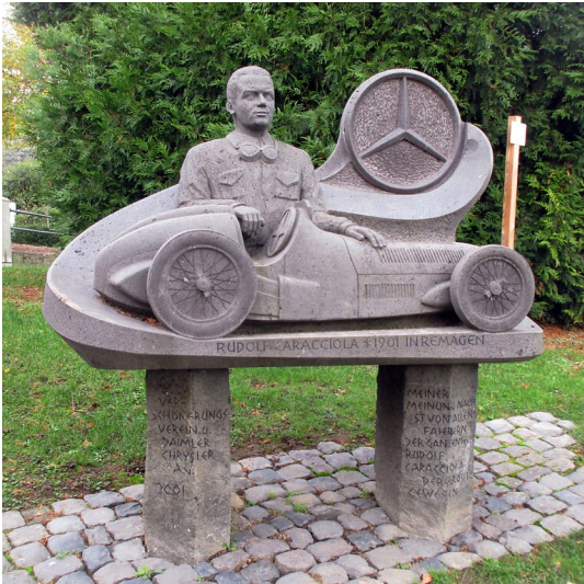
Das Caracciola-Denkmal in Remagen, das an den von hier stammenden Rennfahrer Rudolf Caracciola (1901-1959) erinnert (2020).