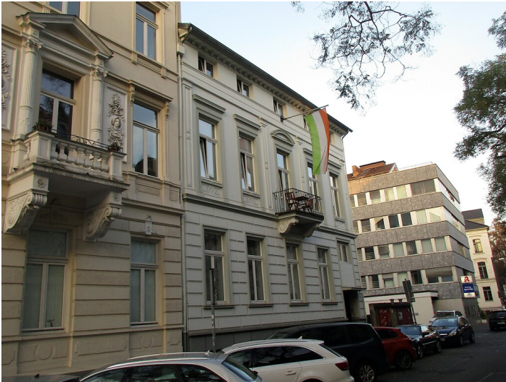
Die östliche Frontfassade der Villa in der Prinz-Albert-Straße 36 in der Bonner Südstadt (2020).