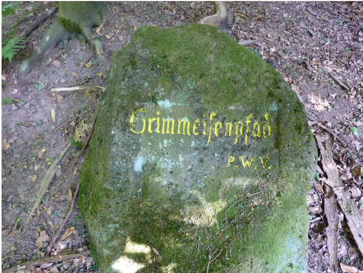
Ritterstein Nr. 47 Grimmeisenpfad am Adelberg bei Annweiler (2013)