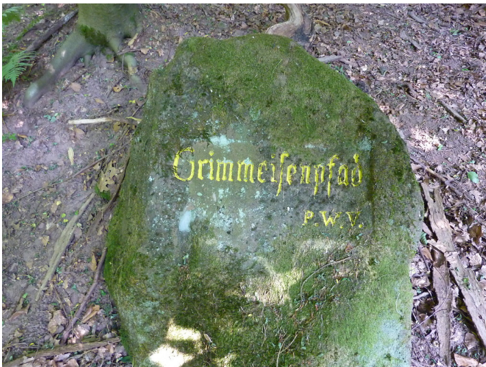
Ritterstein Nr. 47 Grimmeisenpfad am Adelberg bei Annweiler (2013)