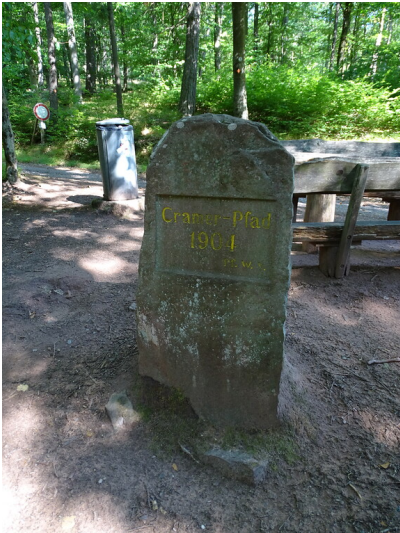
Ritterstein Nr. 43 Cramer-Pfad 1904 an der Ruine Madenburg (2020)