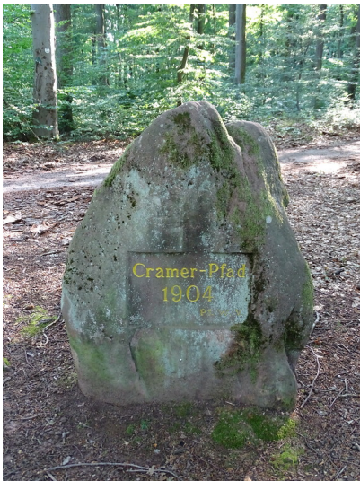
Ritterstein Nr. 42 Cramer-Pfad 1904 bei Bindersbach (2020)