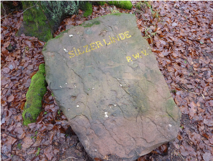
Ritterstein Nr. 34 Silzer Linde nördlich von Birkenhördt (2012)