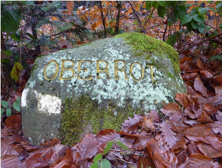
Ritterstein Nr. 33 Oberrot südöstlich von Blankenborn (2012)