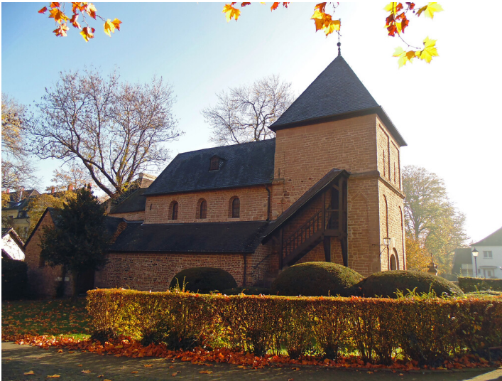
Die Kirche Krieler Dömchen, eigentlich Alt St. Stephan, in Köln-Lindenthal von Norden aus gesehen (2020).