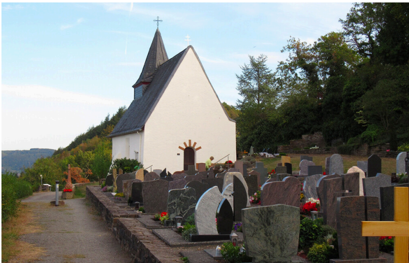
Blick auf die Petersbergkapelle mit Friedhof auf dem Petersberg bei Neef (2020).