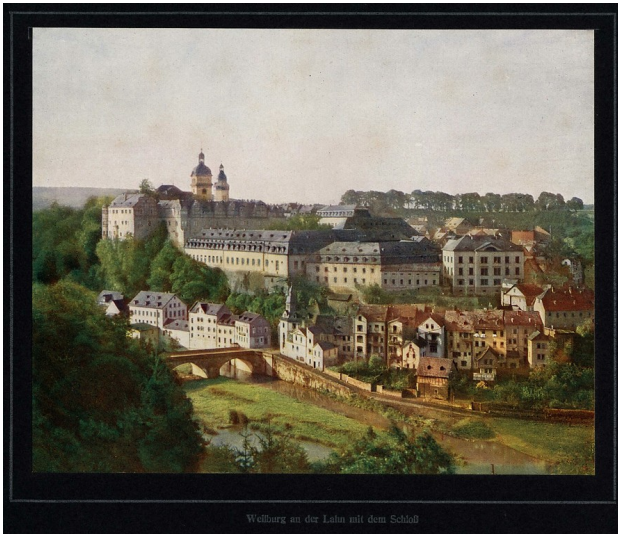
Weilburg, Schloss