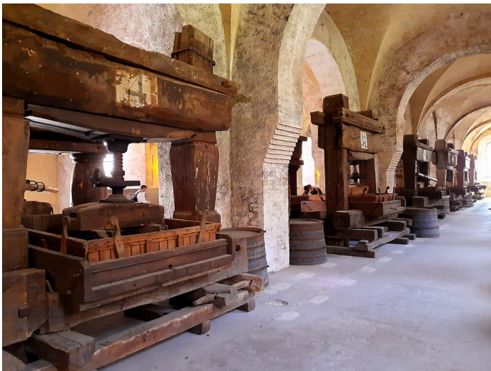
Sammlung historischer Dockenkeltern im Kloster Eberbach in Eltville-Hattenheim (2020).