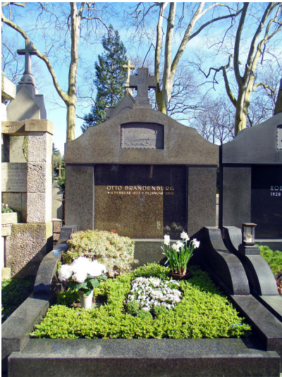
Die massive Grabstätte des Eishockeyspielers Otto Brandenburg auf dem Melatenfriedhof in Köln-Lindenthal (2020).