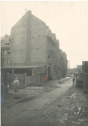
Historische Fotografie des Lützelhofs in Koblenz-Lützel (1932)