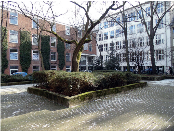
Blick über die Grünanlage des Georgsplatzes in Köln-Altstadt/Süd in Richtung der Kaiserin-Augusta-Schule (KAS) (2021).