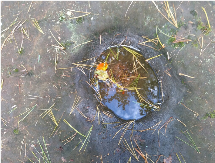
Ritterstein Suppenschuessel (2020)