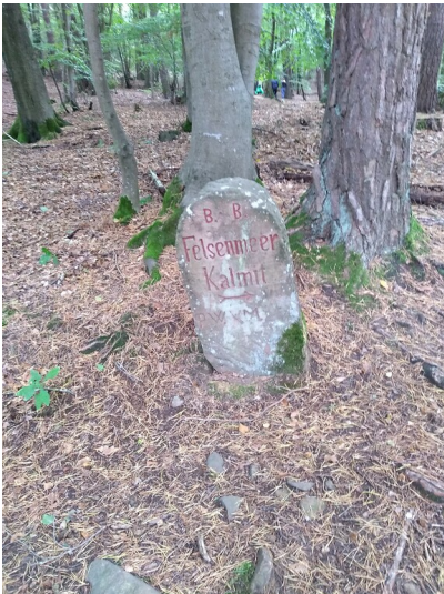
Wegweiserstein "Felsenmeer Kalmit" am Hüttenhohl (2020)