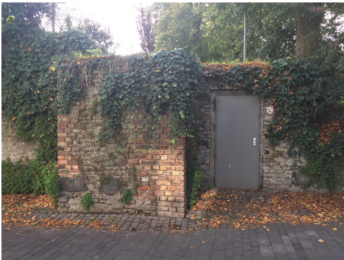
Eingangstüre Bunker Feldtor (2020)