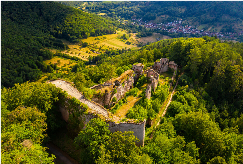
Luftbild der Burgruine Neuscharfeneck auf einem Ausläufer des Kalkofenbergs oberhalb des Dernbachtals (2020)