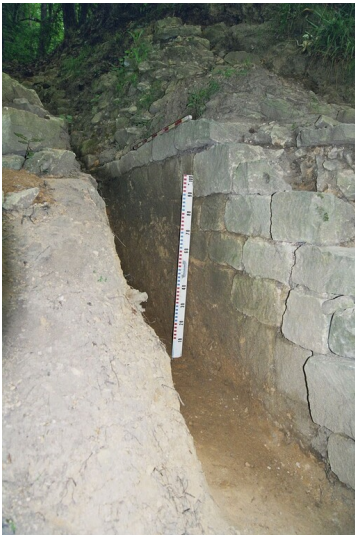
Mauerreste (2007)