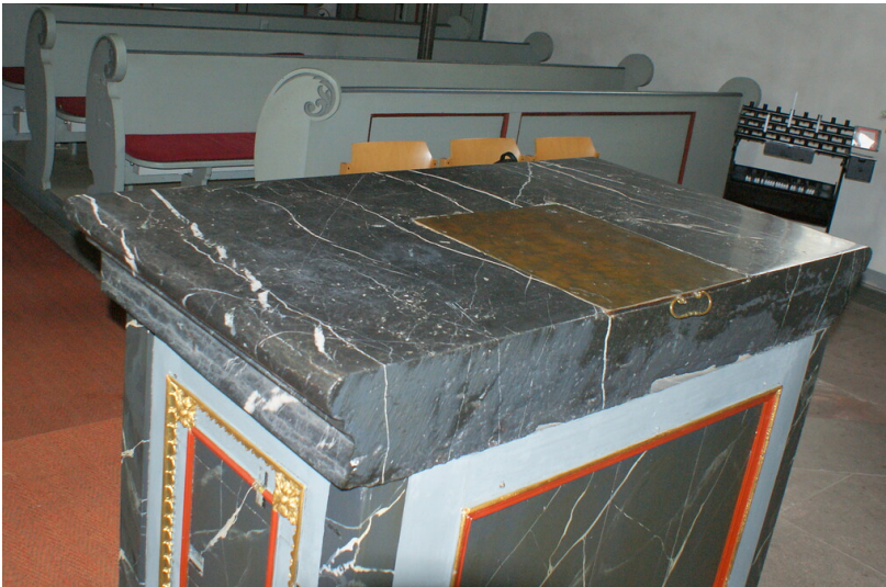
Altar der Löhnberger Schlosskirche (2020)