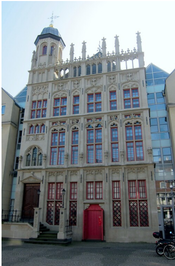
Historische Rathausfassade Wesel (2014)