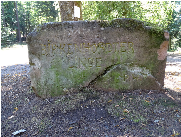
Ritterstein Nr. 199 Birkenhördter Linde südwestlich von Birkenhördt (2020)