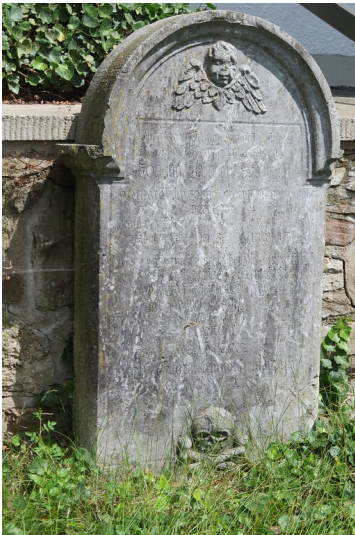
Grabsteine am Kirchhof von Leun (2020)