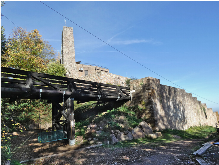
Zugbrücke mit äußerer Ringmauer