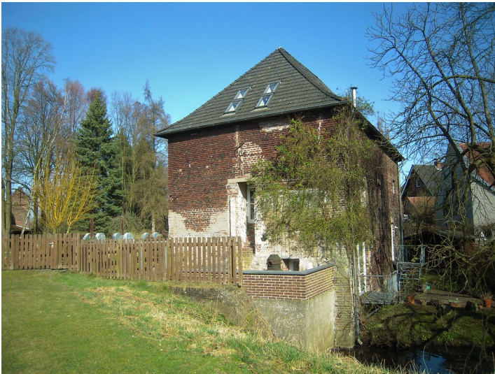
Untere Burgmühle in Schermbeck (2017)