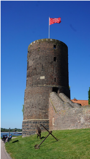
Rees. Mühlenturm (2022)