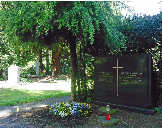
Grab von Max Adenauer und seiner Gattin Gisela, geborene Klein, auf dem Melatenfriedhof in Köln-Lindenthal (2020)