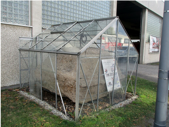
Ein Luftschiffanker des früheren Luftschiffhafens Köln-Bickendorf (2020), aufgestellt in Ossendorf.