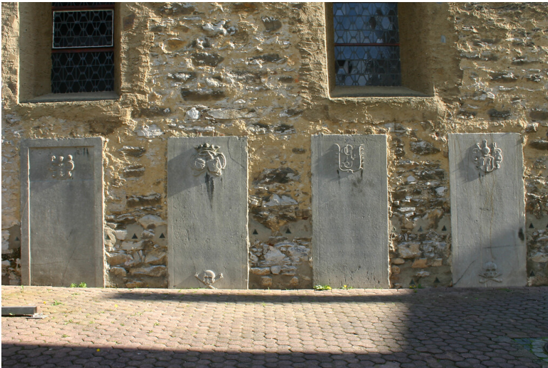
Vier Grabplatten an der Außenwand der Stiftskirche in Diez (2012)