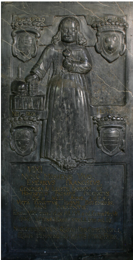
Kindergrabplatte des Emmerich Franz von Hohenfeld in der Stiftkirche zu Diez (2012)