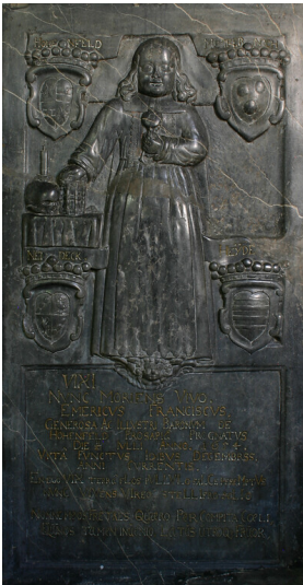
Kindergrabplatte des Emmerich Franz von Hohenfeld in der Stiftkirche zu Diez (2012)