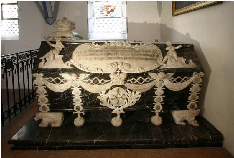
Sarkophag für Fürstin Henriette Amalie von Nassau-Diez in der Stiftskirche zu Diez (2012)