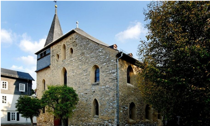
Stiftskirche in Diez (2020)