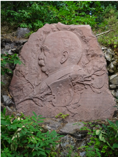
Bismarckstein am Werder-Berg bei Edenkoben (2020)