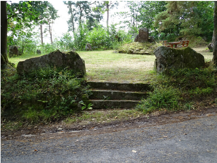
Bismarck-Platz am Werder-Berg bei Edenkoben (2020)