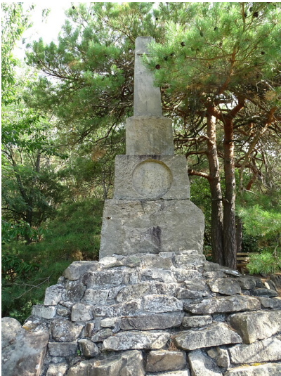
Obelisk "Straßburger Stein" bei Edenkoben (2020)