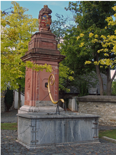
Friso-Brunnen in Diez (2020)