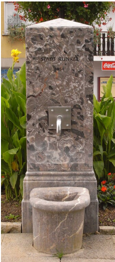
Laufbrunnen in Runkel (2008)