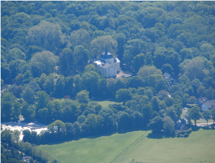
Schloss Eller (2021)