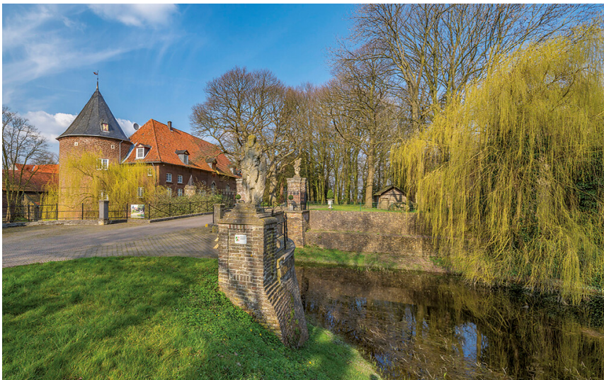
Haus Hueth in Rees-Bienen (2020)