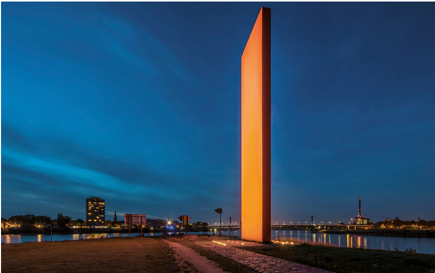
Skulptur Rheinorange an der Ruhmündung in Duisburg-Kaßlerfeld (2020)